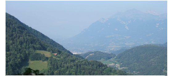
Vue du sentier sur la Vallée...