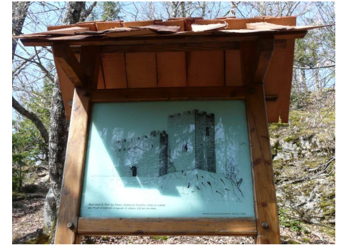
Présentation des ruines du Château de Cornillon