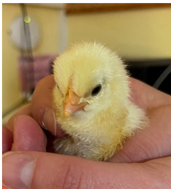
... et le petit dernier !

Une magnifique expérience pour petits et grands car les poussins sont autonomes très vite : ils savent marcher, boire et manger tous seuls dès le premier jour !!!