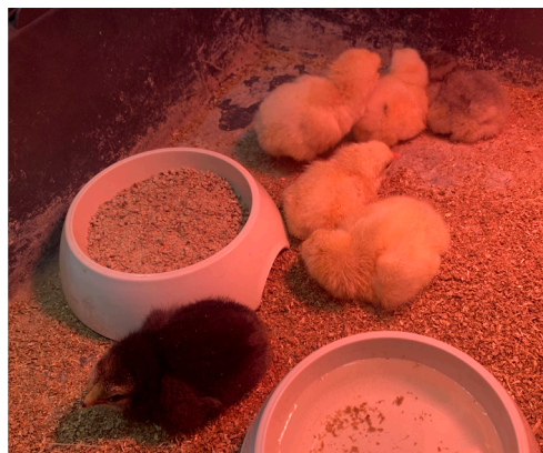
Les 6 premiers bébés...

Slipododo, Blaise, Boufnieuse, Hégésit, Hégésitpa, Alim-Halaya et Skeutédroil. Quand on ne connaît pas les textes de l'auteur, ces noms peuvent paraître bizarre mais pas pour les élèves !