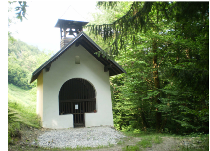
Chapelle du Villaret

Départ : Sortie du chef-lieu, parking côté col de la Forclaz